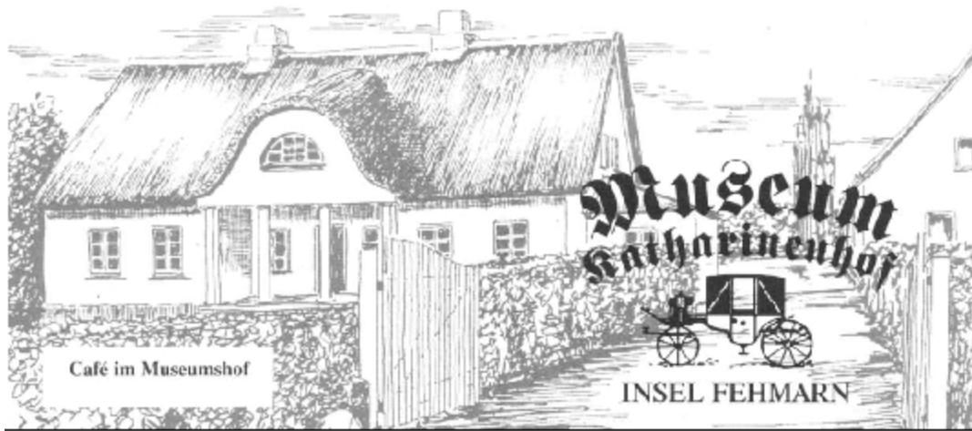
Café im Museumshof