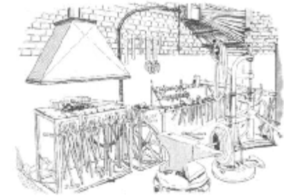
Historische Schmiede-Werkstatt um 1900