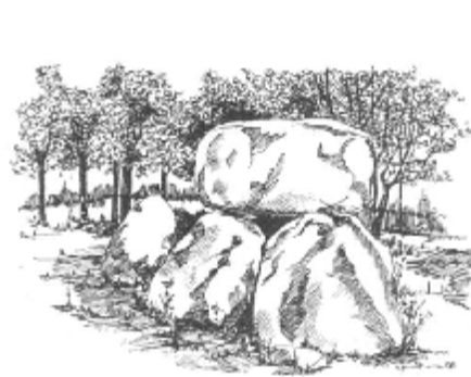
Hüsengrab aus der Jungsteinzeit

Öffnungszeiten: Von Ostern bis Ende Oktober täglich von 11.00 Uhr bis 17.00 Uhr geöffnet Telefon (043 71) 12 30 - Telefax (043 71) 86 48 88