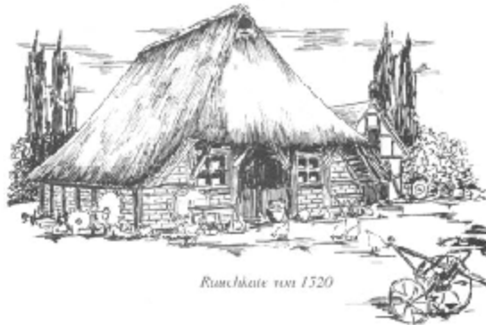
Rauchkate von 1520

Das Backhaus und die 1520 erbaute Rauchkate.