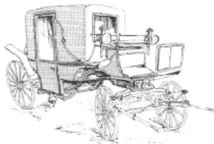
Landauer, Jahr 1860